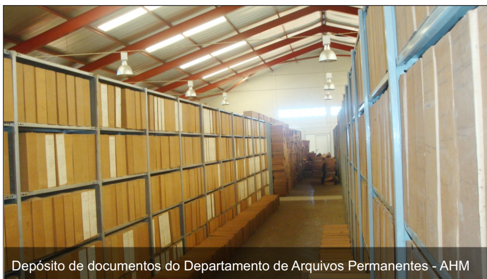
Depósito de documentos do Departamento de Arquivos Permanentes - AHM

Com evolução tecnológica, prosseguiu Tembe, a digitalização surge como um elemento crucial