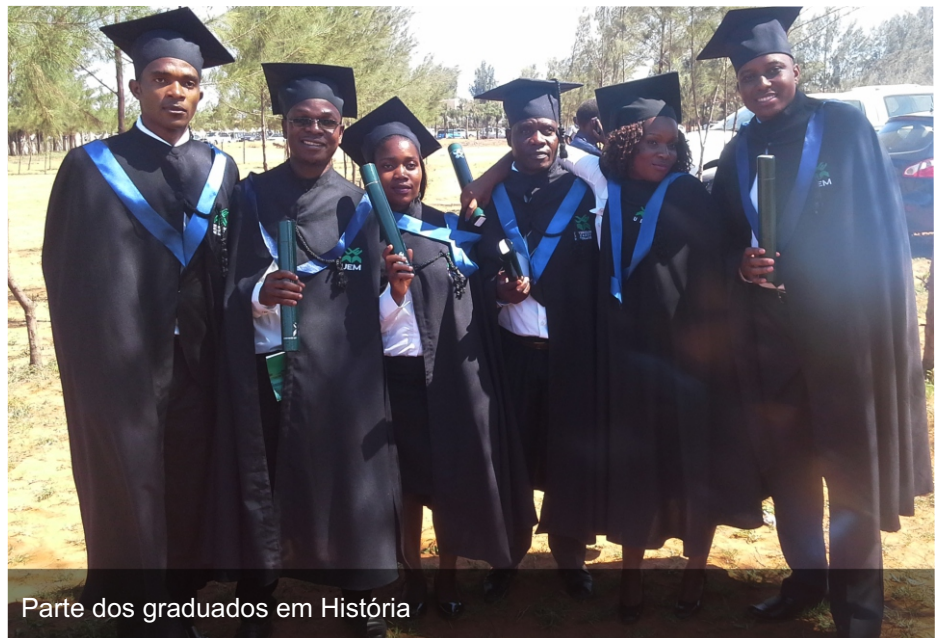
Parte dos graduados em História

De salientar que esta é a segunda cerimónia de Graduação da Universidade Eduardo Mondlane, para o ano 2015, tendo a primeira sido realizada em a 28 de Maio, onde mais de setecentos estudantes foram graduados.