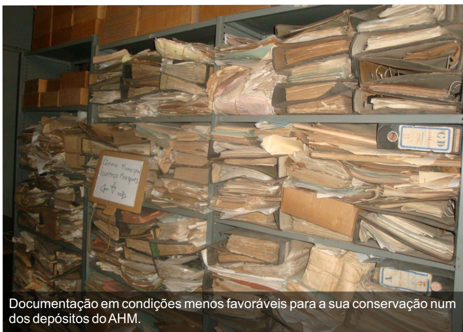
Documentação em condições menos favoráveis para a sua conservação num dos depósitos do AHM.

Fundado a 27 de Junho de 1934, sob o regime colonial português, a AHM é uma instituição tutelada pela Universidade Eduardo Mondlane (UEM), a mais antiga instituição de Ensino Superior em Moçambique. O AHM ocupou, por duas vezes, a presidência da Associação dos Arquivos da África Austral e Oriental, sob ramo do Conselho Internacional de Arquivos. (Lusa)