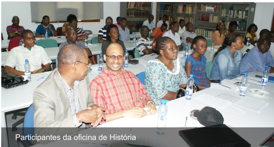
Participantes da oficina de História