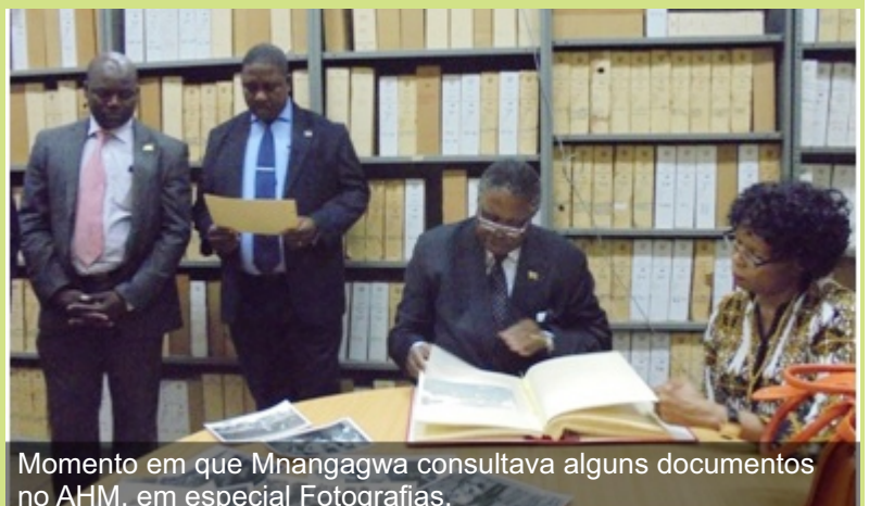
Momento em que Mnangagwa consultava alguns documentos no AHM, em especial Fotografias.