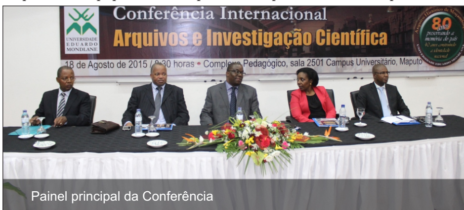
Painel principal da Conferência

Zambeze, a oradora procura perceber as formas do poder público das mulheres. Na sua apresentação, foi possível desprender o facto de que tanto nas