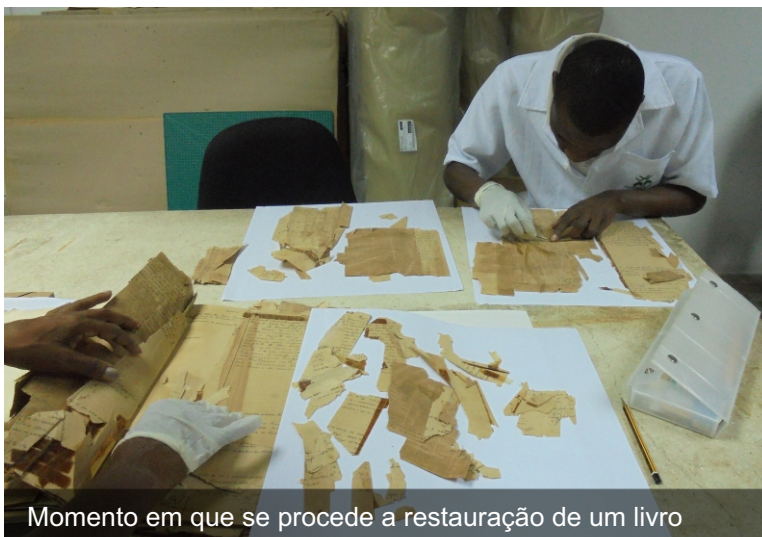
Momento em que se procede a restauração de um livro

RC: A repartição de Conservação e Restauro de um modo geral é responsável pela preservação do acervo documental.