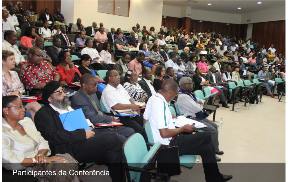
Participantes da Conferência