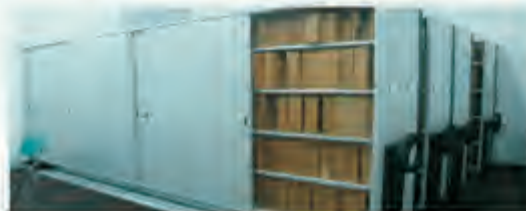
Documentos de arquivo em estanteria compacta