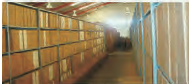
Documentação arquivística no Campus Universitário.

Em 2007, é instituído o Sistema Nacional de Arquivos de Estado (SNAE), pelo decreto 36/2007, de 27 de Agosto, o qual revoga o decreto 33/92 do Sistema Nacional de Arquivos. No âmbito da nova legislação, o Ministério da Função Pública assume a função coordenadora, sendo o Arquivo Histórico de Moçambique seu assessor técnico.