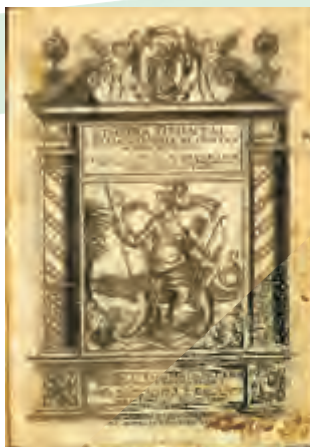
Etiópia Oriental (1508)-Um dos livros mais antigos da Biblioteca do AHM