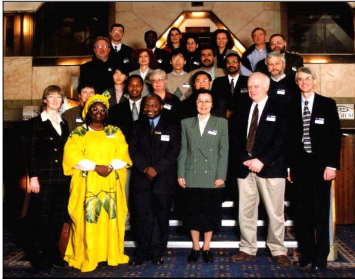
Participantes no seminário sobre “Libraries, Museums and Archives: a collaborative venture in the digital age”

De 28 de Janeiro a 2 de Fevereiro participou no seminário sobre “Libraries, Museums and Archives: a collaborative venture in the digital age”, organizado pelo International Networking Events in Britain, The British Council . Este seminário tinha como objectivo discutir aspectos relativos ao papel dos arquivos, bibliotecas e museus e a partilha de responsabilidades futuras como organizações de memória e de prestação de